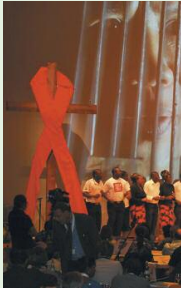
Ein Chor von HIV-Infizierten aus Simbabwe begleitete die HIV/Aids-Anhörung musikalisch und berichtete anschaulich von den Erfahrungen der HIV-Infizierten.

9 [...] Ernährungsgerechtigkeit: Wir sind uns bewusst, dass angemessenes und nahrhaftes Essen lebenswichtig ist und sehen voller Erschütterung, dass auf der einen Seite große Teile der Weltbevölkerung Armut und Hunger leiden und auf der anderen 40 Prozent aller Nahrungsmittel nicht gegessen, sondern weggeworfen werden. Dies stellt eine Verleugnung der Tatsache dar, dass Nahrungsmittel kostbar sind. Die Antwort ist nicht, leere Teller mit billiger Wohltätigkeit zu füllen, sondern das teure Streben nach Gerechtigkeit um dieser und künftiger Generationen willen. Die direkte Unterstützung von Hungernden und Marginalisierten muss mit Entwicklungsarbeit und Bildung kombiniert werden. Unsere Arbeit muss Menschen ermächtigen, für ihre eigenen Rechte und ein Leben in Würde zu kämpfen.