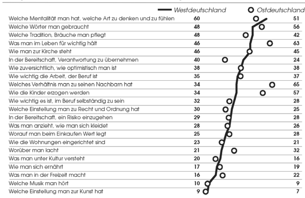
Schaubild 1: Unterschied zwischen Ost und West 15 Jahre nach dem Fall der Mauer Frage: "Wodurch unterscheiden sich ihrer Meinung nach Ost- und Westdeutschland?"

Basis: Bundesrepublik Deutschland; Bevölkerung ab 16 Jahre